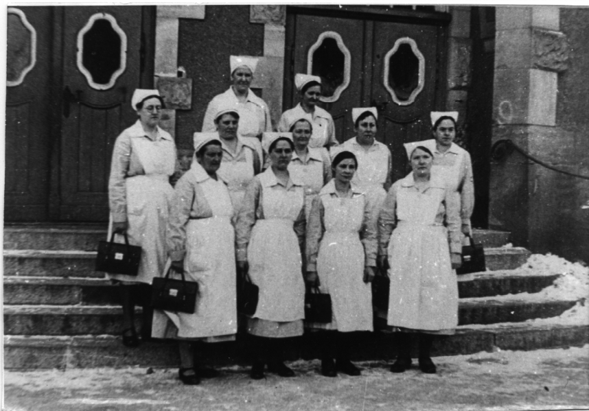
Aus der Anfangszeit: Erfurter Arbeiter-Samariterinnen in den 1920er Jahren